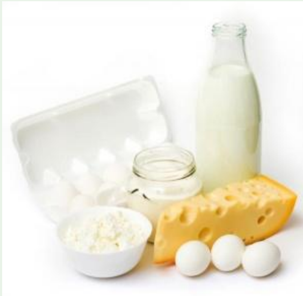
Рис. Продукты в которых находится витамин Д.