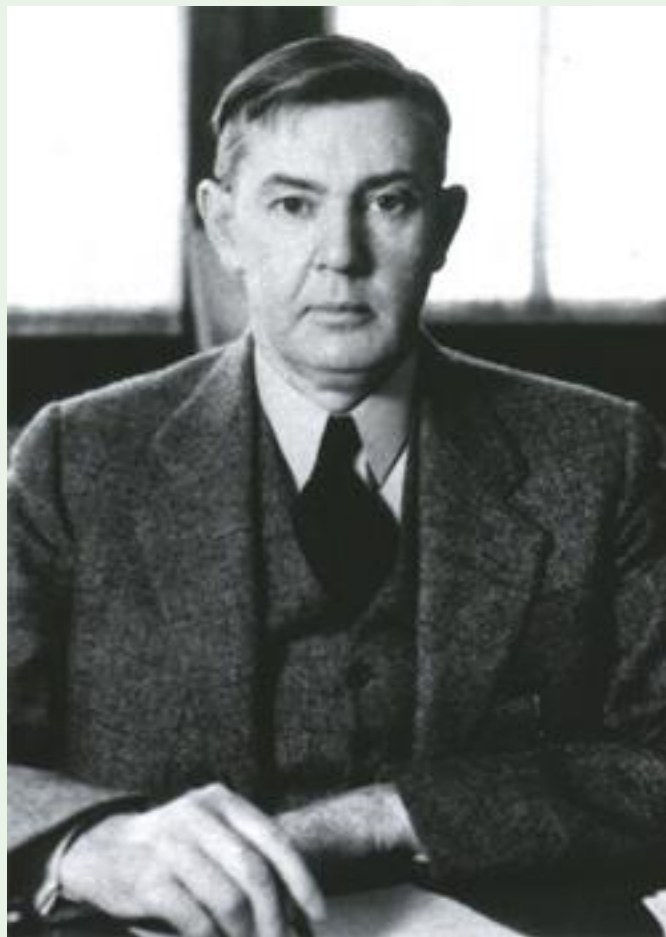
Рис. Элмер Макколум