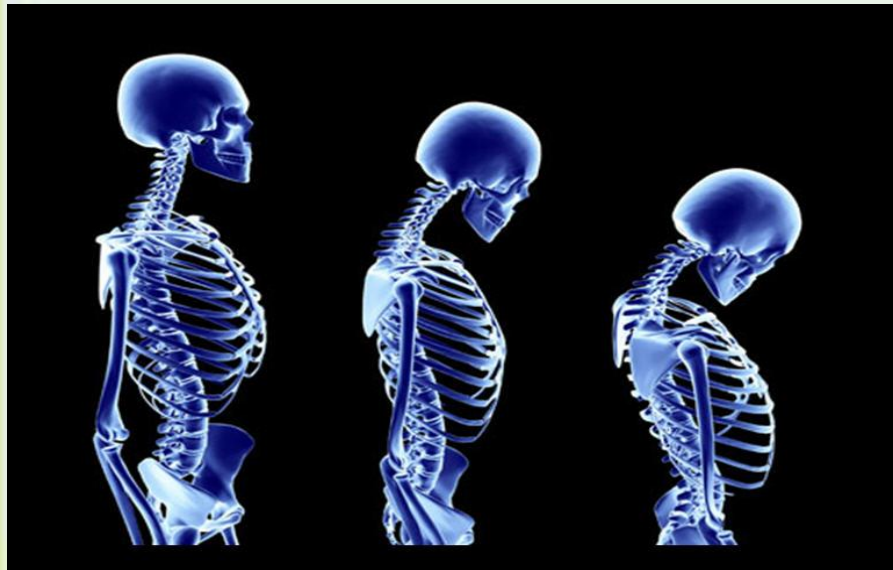
Рис. Заболевание остеопорозом.